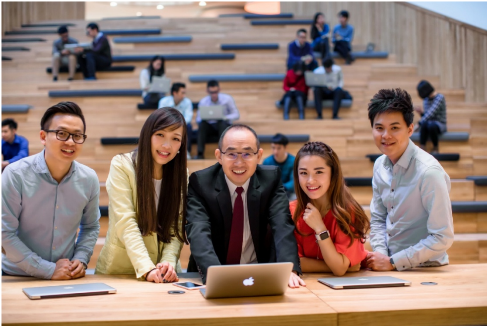
(SOHO3Q 已經成為中國最大的共用辦公空間)

在過去的一年中，SOHO3Q 在北京和上海建成了 11 個中心，1 萬多個座位已經投入使用，擁有三萬多會員，已經成為中國最大的共用辦公提供商。SOHO3Q 的社區已經逐步形成規模，彙集了來自教育、醫療、IT 等各個行業、各種規模的公司和創業者。下一步，公司將聚焦在建立和完善 SOHO3Q 會員體系上，邀請更多人成為 SOHO3Q 會員，讓用戶可以享受更靈活的服務。