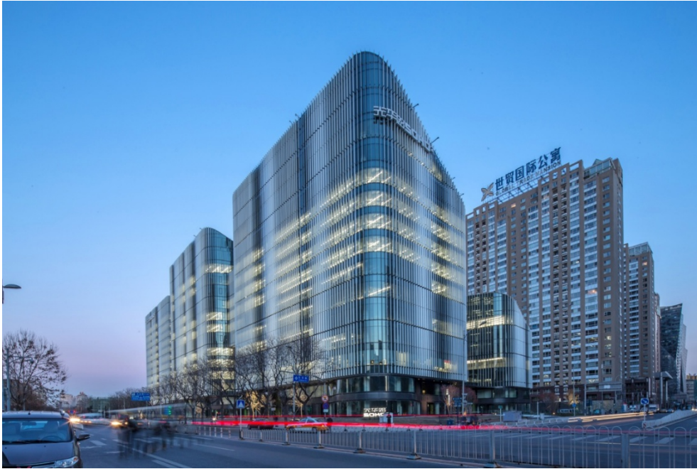
（光華路 SOHO 二期）

漲了 25.1%，SOHO 世紀廣場的上漲了 24.7%。如此大量新增辦公樓的出租，即使是在紐約、香港、東京等國際大都市，在短短一年時間裡完成也是非常困難的。